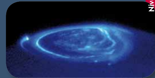
Aurore polaire, photographiée dans le domaine des ultraviolets par le télescope spatial Hubble

L'interaction du vent solaire avec la magnétosphère jovienne produit d'impressionnantes aurores polaires.