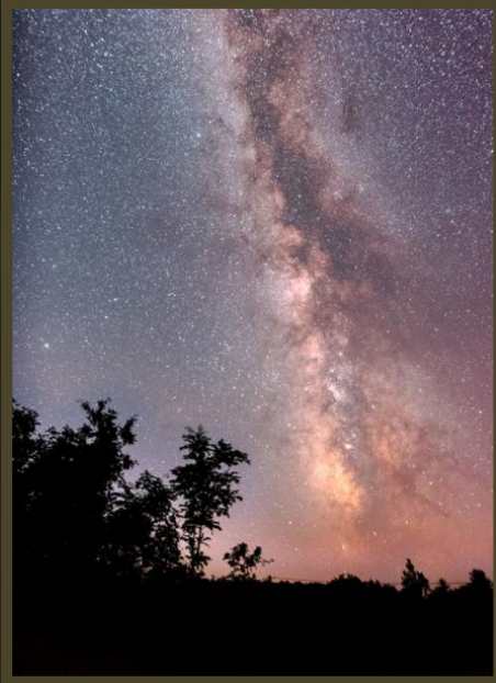
Pascal - VL dans les Cévennes