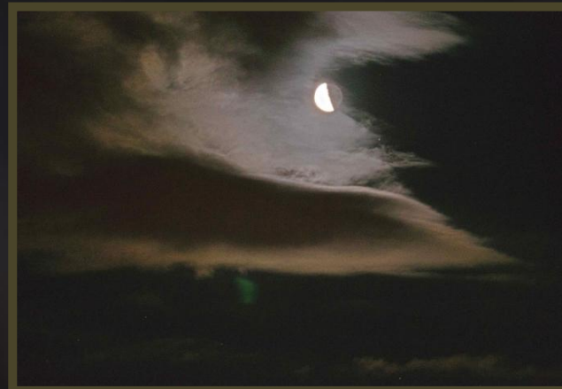
Bernadette - Sallanches