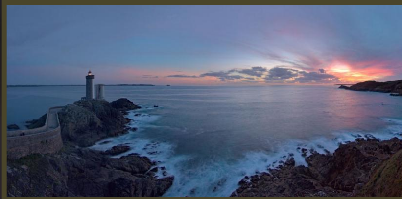
Yvan - Phare du minou à Plouzané