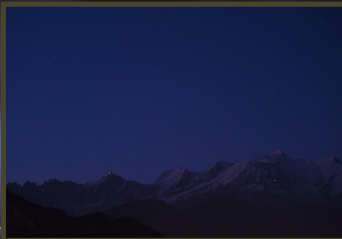
Bernadette - Les cordées au Mont Blanc