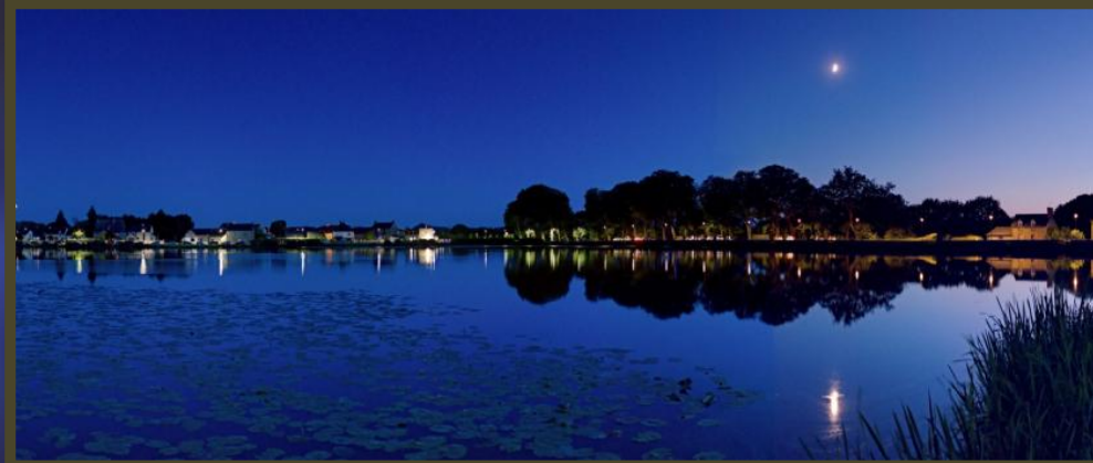
Yvan - Lac tranquille à Combourg