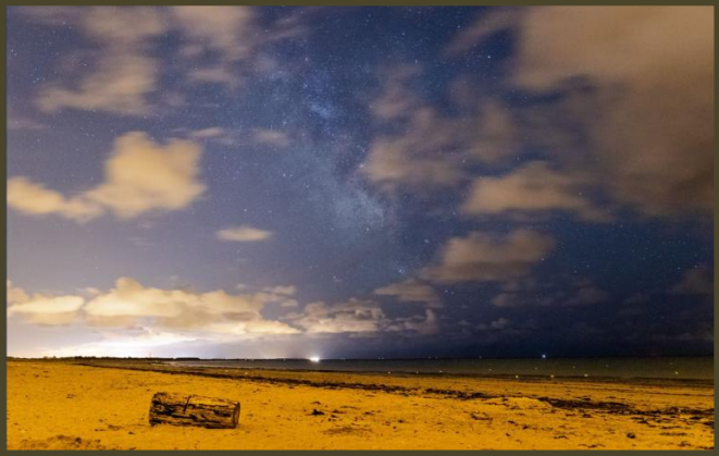
Guillaume D : VL en Corse