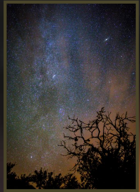
Pascal - VL dans les Cévennes