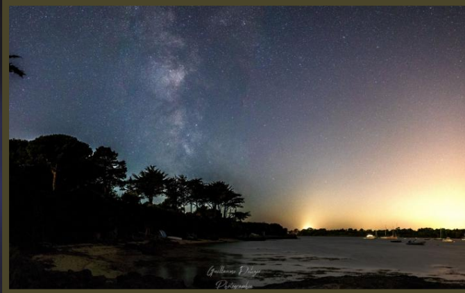
Guillaume D : VL au port du Logeo